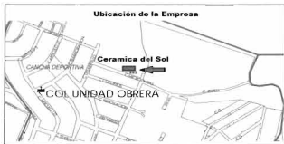
Mapa 7: Ubicación de la empresa "Cerámica del Sol"