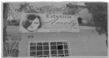
Anexo 2. Empresa estética "Amely"