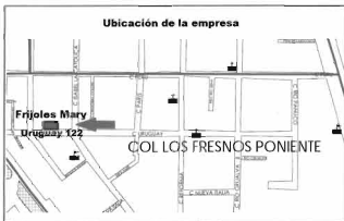
Mapa 9: Ubicación de la empresa Frijoles "Mary"