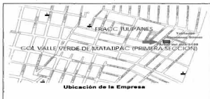
Mapa 8: Ubicación de la empresa "Hermanas Gómez"

Fuente: elaboración propia con base en cartografía proporcionada por el IFE.