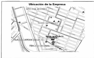
Mapa 5: Ubicación de la empresa de papelería