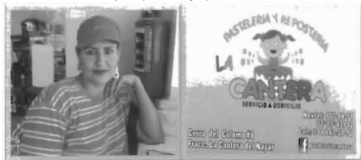
Anexo1. Empresa pastelería y repostería "La Cantera"

Fotografías de las empresas y empresarias