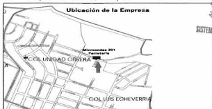
Mapa 6: Ubicación de la empresa de ferretería