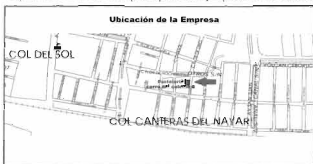
Mapa 2: Ubicación de la empresa pastelería y repostería "La Cantera"