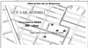
Mapa 4: Ubicación de la empresa Pescadería "Nery"