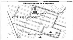
Mapa 3: Ubicación de la empresa estética "Amely"