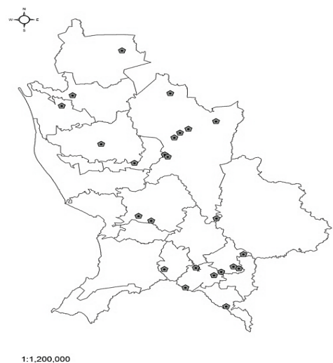
Figura 1. Ubicación geográfica de los sitios de colectas de accesiones de especies de calabaza cultivada en Nayarit.

Quantitative variables: internode length (LE), the average thickness of the peduncle (GPMP), peduncle length (LP), thickness of the base of the peduncle (GBP), fruit length (LF), width of fruit (AF), fruit weight (PF), thickness of the fruit pulp (GPF), thickness of the rind of the fruit (GCF), number of seeds per fruit (NSF), the seed length (LS), width of the seed (AS), thickness of the seed (GS), weight of 100 seeds (P100S).