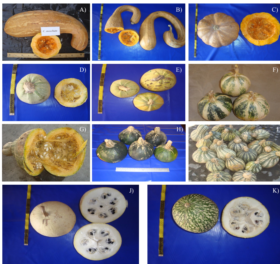
Figura 5. Accesiones de calabaza cultivadas en Nayarit: Cucurbita moschata (A, B y C), Cucurbita pepo (D, E y F), Cucurbita argyrosperma (G, H e I), y Cucurbita ficifolia (J y K).

The accessions of group V and VI belong to C. moschata (Figure 4: A, B and C), both groups differ in weight and width of fruit, the group V showed the highest values of these characteristics; with respect to the group VI, previous values were on a smaller scale (Table 3), both groups had salmon flesh; Moreover, a characteristic feature within both groups of this species is fruit shape; the group V presented fruits of globular or flattened with ribs, while the sixth had curved shapes (of crop) and in both groups the number of seeds per fruit showed the highest values.