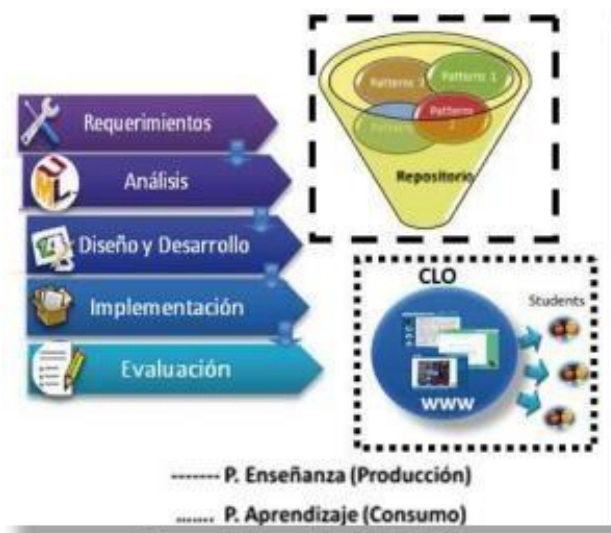
Figura 1. Metodología MACOBA

La Figura 1 , muestra la el proceso para la producción de OA, partiendo del nivel de requerimientos, pasando por el análisis y finalmente su desarrollo e implementación.