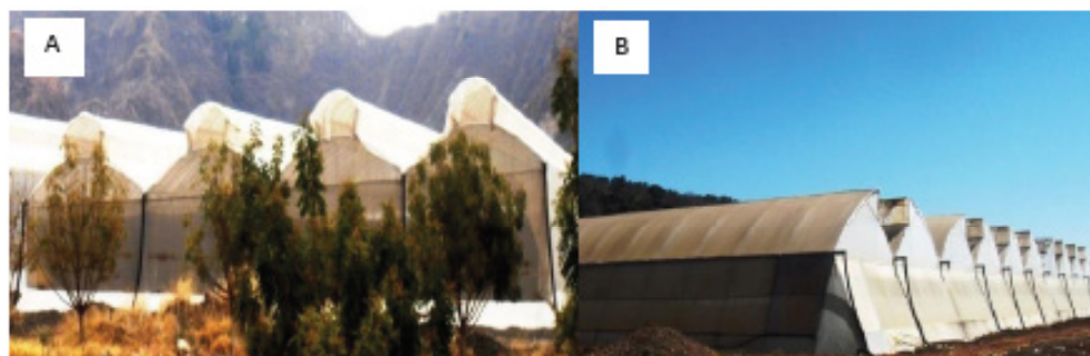
Figure 3. A. Multitunnel greenhouse type chapel in Jala, Nayarit. B. Multitunnel greenhouse type gothic in Tepic; Nayarit, Mexico.

En lo que respecta a los macro túneles, sus componentes estructurales son de acero, cubierta plástica en la parte superior (arco), sogas y accesorios de sujeción. El ancho del