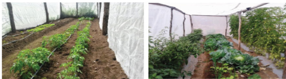
Figure 1. A. Design and basic structure of anti-aphid house and B. Diversity of species in anti-aphid house. (Photography: SAGADERP, Nayarit).