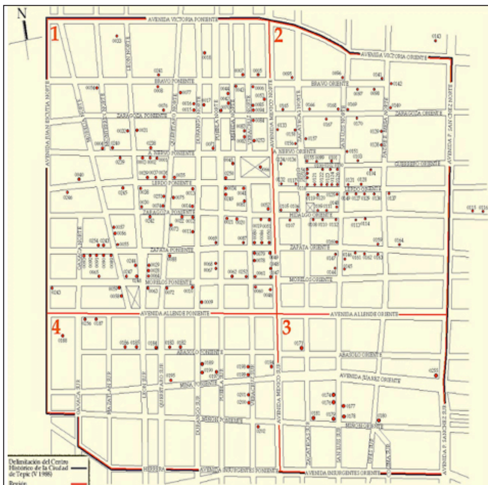
Figura 2. La delimitación del centro histórico de Tepic y la división de sus cuatro regiones. Los inmuebles catalogados por el INAH están señalados por un punto rojo con su respectiva clave del Catálogo Nacional de Monumentos Históricos Inmuebles.

Desde esta legislación estatal, presurosamente se determinó qué era patrimonio histórico, turístico y cultural de interés local, lo que dio origen a su institucionalización desde el discurso de que su conservación era de utilidad pública. Un mes después, el 13 de noviembre de 1989, en un cuaderno de divulgación legislativa de la Cámara de Diputados del Congreso del Estado, se publicó el Acuerdo Ejecutivo de la Declaratoria de Inmuebles del Patrimonio Histórico y Cultural del Centro y Municipio de Tepic, donde se establecieron por primera vez los límites físicos del centro histórico de Tepic. Este se compondría de 146 manzanas que se incluirían en un polígono delimitado entre las avenidas Guadalupe Victoria al norte, Prisciliano Sánchez al oriente, de Los Insurgentes al sur, y Juan Escutia en conjunto con la calle Oaxaca al poniente. La zona, además, se habría subdividido en cuatro regiones a través de límites cartesianos formados por las avenidas México de norte a sur, e Ignacio Allende de oriente a poniente (figura 2).