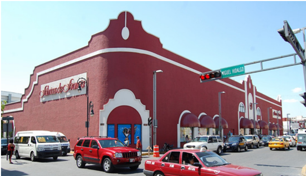
Figura 8. Tienda departamental Fábricas de Francia. Su ampliación en 1999, abarcó la totalidad de su manzana. Tratando de ocultar construcciones previas, levantó sus paramentos con grandes remates.