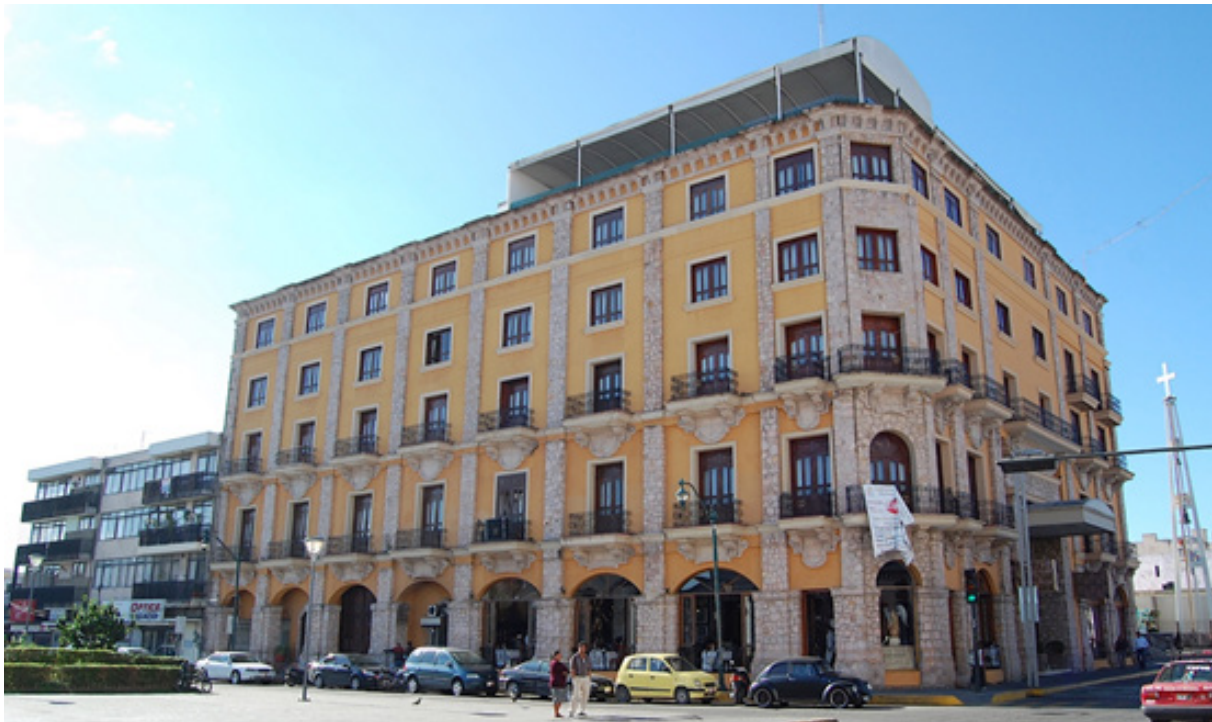
Figura 6. El Hotel Real de Don Juan. Avenida México esquina con Javier Mina. Desde que fue remodelado y ampliado en 1994, ha sido, institucionalmente, el modelo para homogenizar la imagen urbana del centro histórico de Tepic.