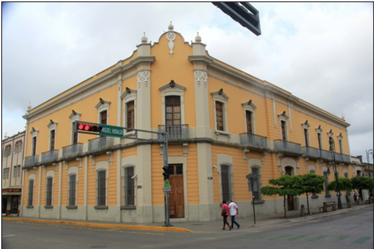
Figura 5. Antigua Casa Aguirre (Centro de Arte Contemporáneo Emilia Ortiz). Avenida México esquina con Miguel Hidalgo. Inmueble datado a finales del siglo XIX, la edificación responde a un eclecticismo, con elementos propios del neorrenacimiento.

La consolidación de este falso histórico dentro de la ciudad, a partir de esta nueva expresión estética de lo colonial, viene acompañada de una imposición de estandarización edilicia. El peligro de estas acciones es que, de manera paralela, se pretende hacer un museo urbano donde las transformaciones por el paso del tiempo son impensables y en el que, de manera arbitraria, se intenta una mayor valoración de esta fingida arquitectura colonial y un soslayo de la tradicional.