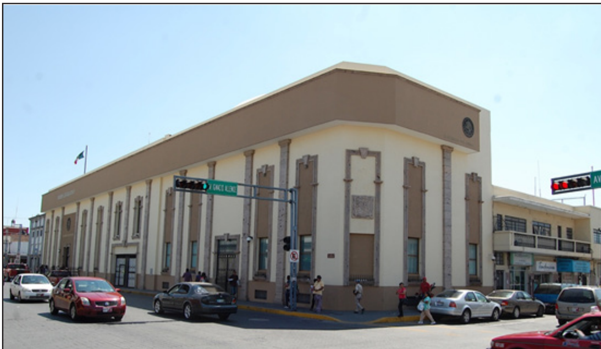
Figura 7. Sede del Congreso del Estado de Nayarit. En 1995 se intervino este inmueble sobre lo ya construido siguiendo el mismo patrón ornamental del Hotel Real de Don Juan.