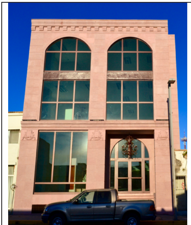
Figura 9. Edificio comercial en alquiler. La utilización de materiales y elementos decorativos, en especial la simbología en relieve simulando insignias con heráldicas, son parte del nuevo lenguaje.