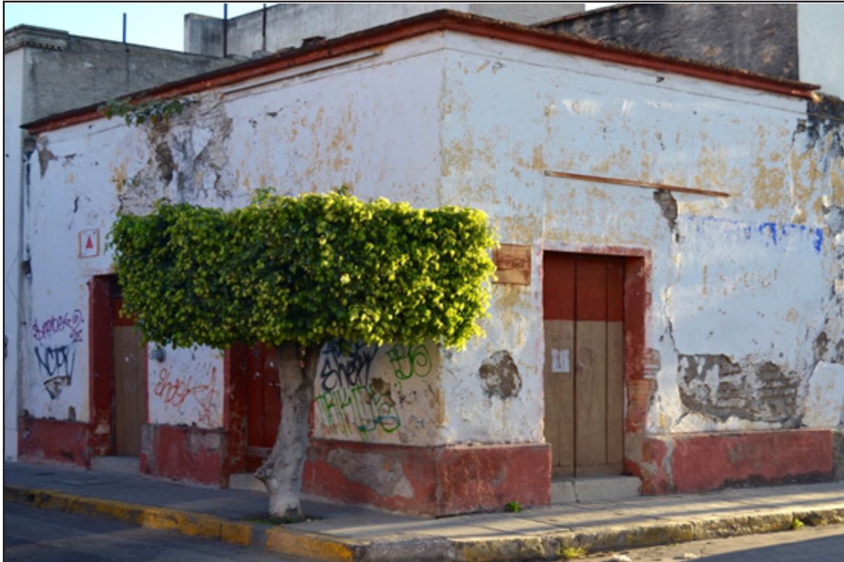
Figura 4. Edificación típica no catalogada.

das, se utilizan adjetivos lacónicos como típicos (figura 4). Esta colonización ha ido más allá. La parte académica, aquella que por definición permanece incólume, se ha sometido también a este canon idealizado. De esta manera, a la suma de estos elementos estilísticos, y auspiciados por dicho Instituto, tanto coloquial como académicamente, se le ha establecido el calificativo de colonial .