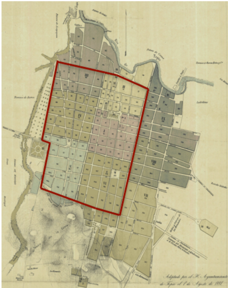
Figura 3. Plano de la ciudad de Tepic de 1880. Con línea roja se muestra el perímetro del actual centro histórico de Tepic.

que, se supone, sin contar las persistencias, habían permanecido y persistido 12 en el espacio-tiempo de la ciudad.