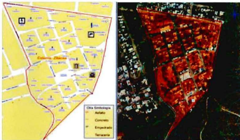
Imagen 1. Ubicación de Zitakua en Tepic