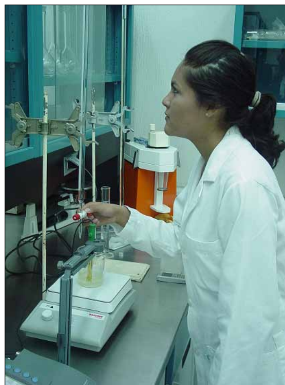
Figura 3. Extracción y caracterización de fructanos de Agave tequilana

Como parte del proyecto Desarrollo de una botana mediante el proceso de extrusión a base de frijol y enriquecida con fructanos de agave del estado de Nayarit, ejecutado conjuntamente por el Centro de Investigación y Asistencia en Tecnología y Diseño del Estado de Jalisco, A. C. y la Universidad Autónoma de Nayarit, bajo el patrocinio del Fondo Mixto Conacyt-Gobierno del Estado de Nayarit, el Cuerpo Académico de Tecnología de Alimentos de la UAN, ha realizados estudios sobre la extracción y caracterización fisicoquímica de fructanos de Agave tequilana Weber variedad azul cultivado en el estado de Nayarit. Los resultados obtenidos permitirán evaluar su potencialidad como ingrediente en la elaboración de productos funcionales, específicamente para el desarrollo de la botana de frijol antes mencionada 🍃