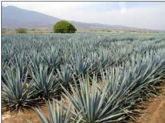
Figura 2. El Agave tequilana Weber variedad azul es buena fuente de fructanos.

drato de reserva. Los tallos de Agave veracruz y de Agave tequilana almacenan una mezcla compleja de fructooligosacáridos, inulinas, neoseries de inulinas y fructanos ramificados.