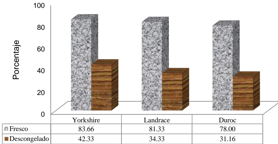
Gráfica 2. Porcentaje de espermatozoides vivos en semen fresco y descongelado en los diferentes grupos raciales estudiados.