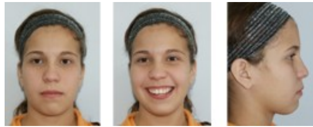
Figura 5. Fotografías Extraorales después del tratamiento

El grado de corrección con aparatología funcional sagital es de 6-7 mm de adelantamiento mandibular.