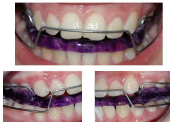
Figura 3. Aparato Bionator