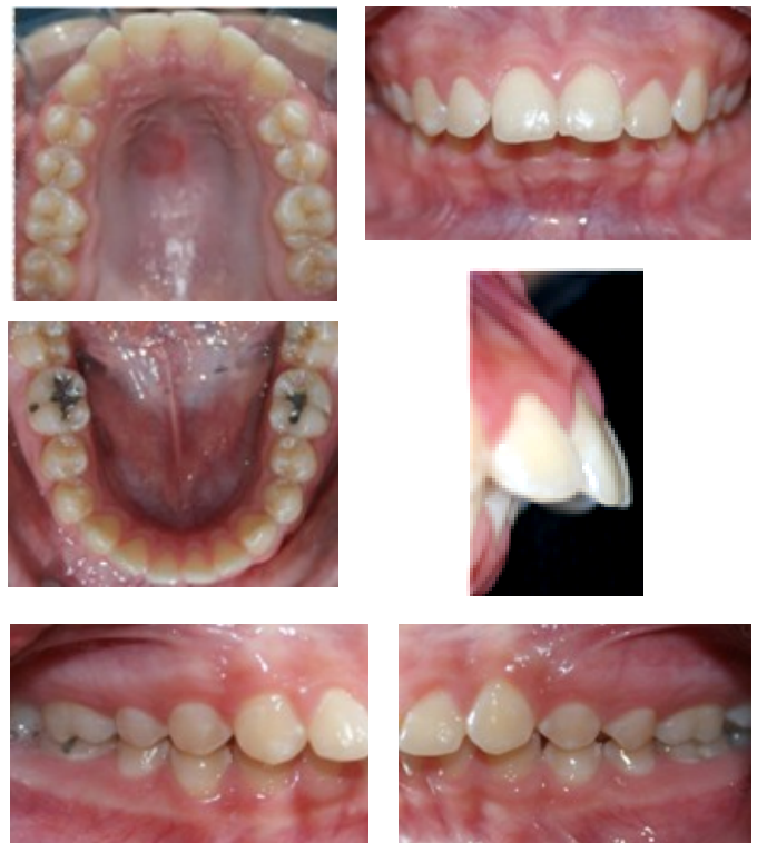
Figura 2. Fotografías intraorales